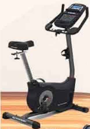
Upright Bike 570U