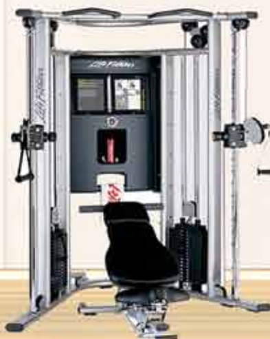
G7 Home Gym