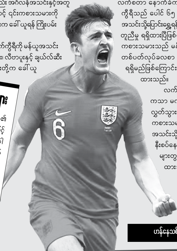
ဟန်နုသစ် စုစည်းသည်

လက်စတာ အသင်းကသာ မက်ကီရီကို လက်လွှတ်သွားမည်ဆိုပါက ၎င်းကစားသမားသည် မန်ယူအသင်းသို့သာ ရောက်ရှိရန် နီးစပ်နေကြောင်း သတင်းများတွင် ထပ်မံဖော်ပြထားသည်။